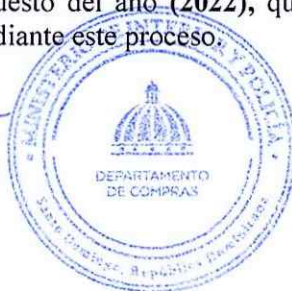
Wilda Castillo Enc. Dpto. de Compras y Contrataciones